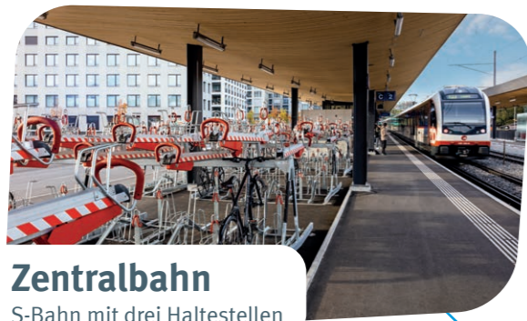
Zentralbahn S-Bahn mit drei Haltestellen