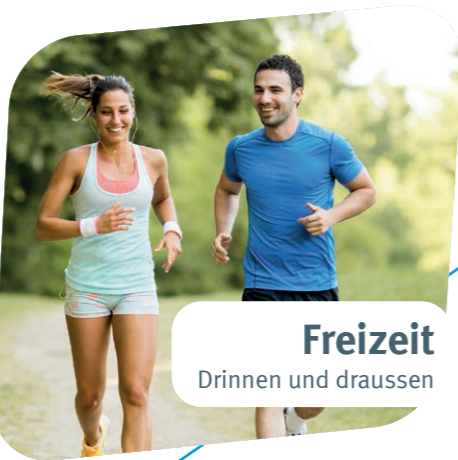
Freizeit Drinne und draussen