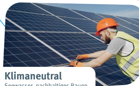
Klimaneutral Seewasser, nachhaltiges Bauen