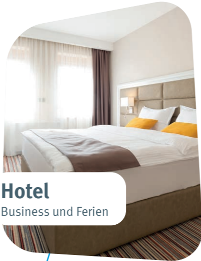
Hotel Business und Ferien