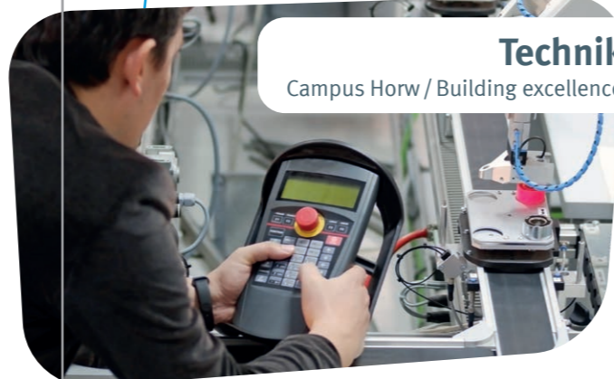
Technik Campus Horw / Building excellence