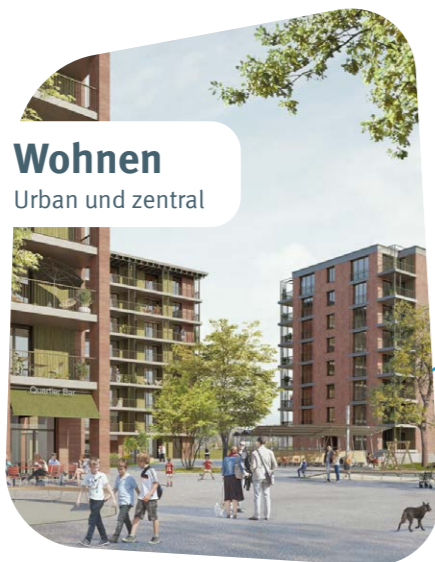
Wohnen Urban und zentral