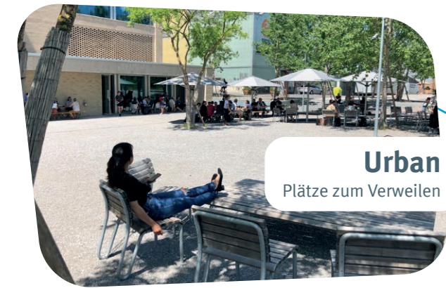
Urban Plätze zum Verweilen