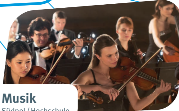
Musik Südpol / Hochschule