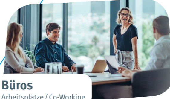
Büros Arbeitsplätze / Co-Working