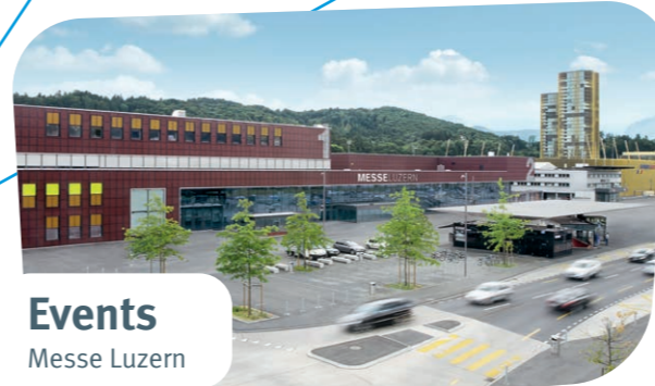
Events Messe Luzern