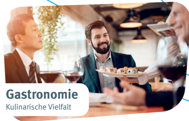
Gastronomie Kulinarische Vielfalt