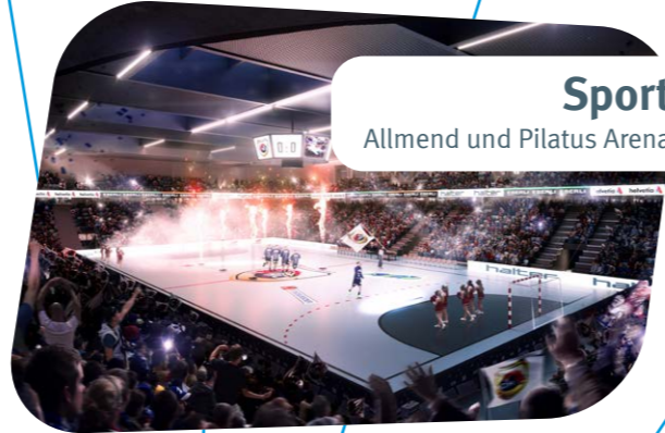
Sport Allmend und Pilatus Arena