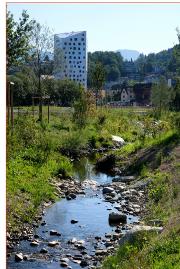
Entspannen am Steinibach: Der Ziegeleipark in Horw.