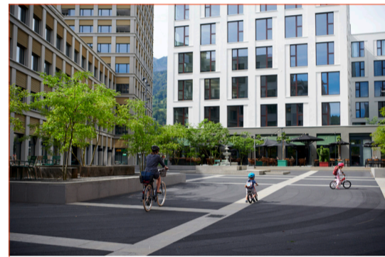
Ein gemütlicher Ort zum Verweilen und Staunen: Die Piazza Mattenhof im Herzen des urbanen Quartiers.