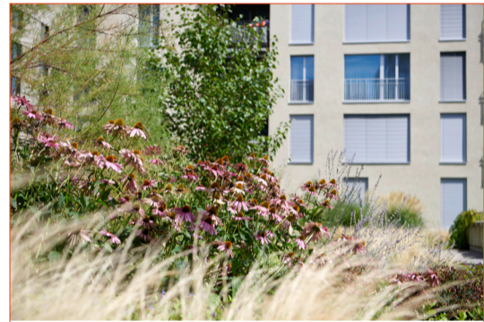
Wildes Grün für Bienen und Menschen: Der Schweighofplatz.