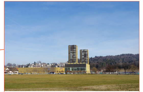
Die höchsten Wohngebäude der Innerschweiz: Hochzwei in der Allmend.