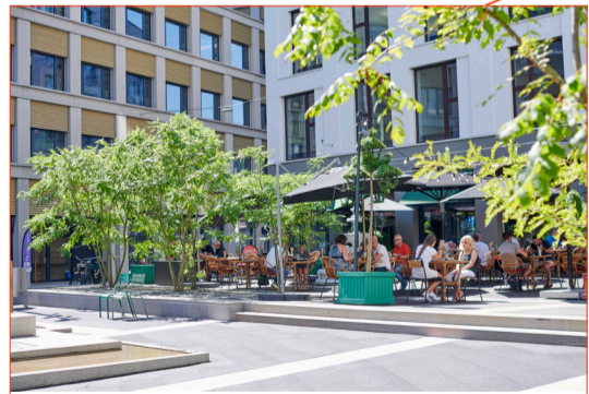
Kulinarisch quer durch Asien reisen: Das Restaurant Nooch am Mattenhof.