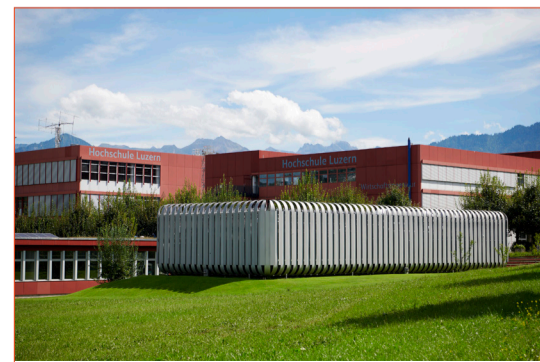
Fragen rund um Gebäudeintelligenz: Das iHomeLab der HSLU in Horw.