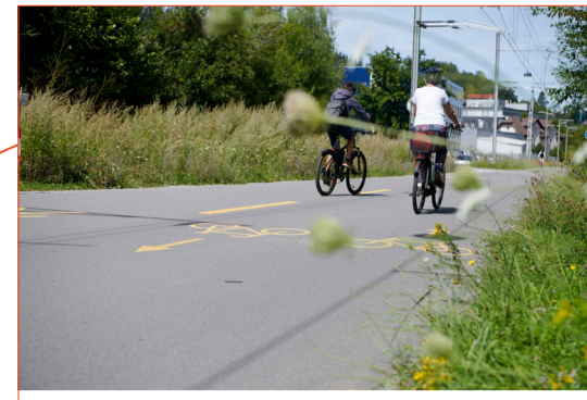
Wir sind mit dem Velo da: Unterwegs auf der Langsamverkehrsachse Freigeis.