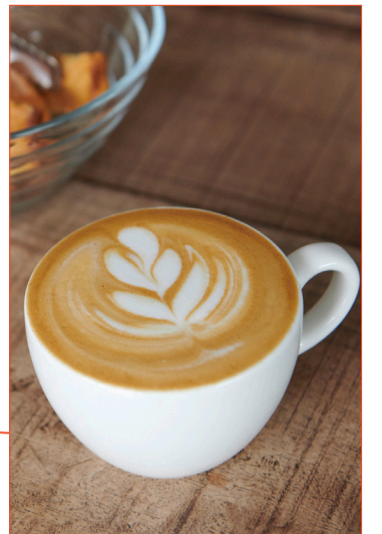
Hausgerösteter Kaffee: Café Tacuba direkt am Freigeis.