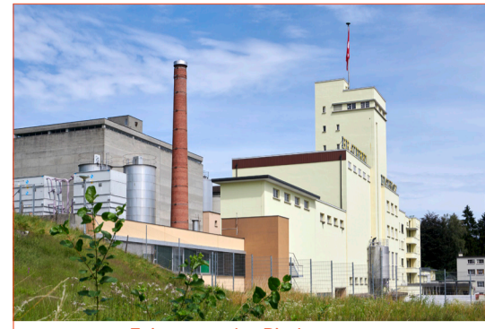
Zeitzeugen des Bierbrauens: Das Eichhof-Areal am Eingang zu Luzern Süd.