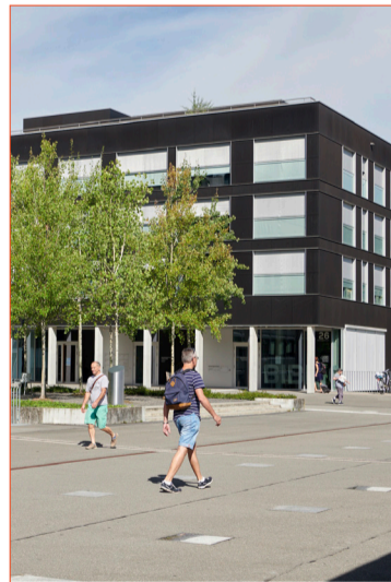
Neugestaltung mit Modellcharakter: Das Horwer Zentrum.