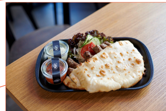
Feinste Grillspezialitäten am Mattenhof: Jack's Cevap House.