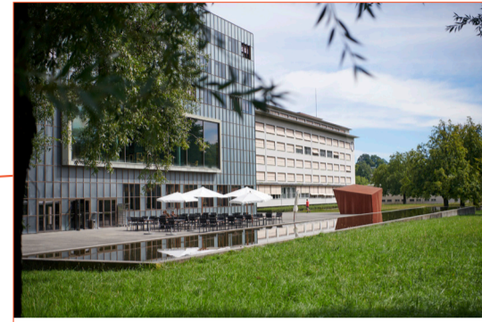
Überraschende Architektur in der Allmend: Das Armeeausbildungszentrum mit der Kaserne.