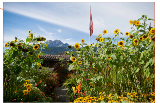
Bauern en miniature: Die Schrebergärten am Mattenhof.