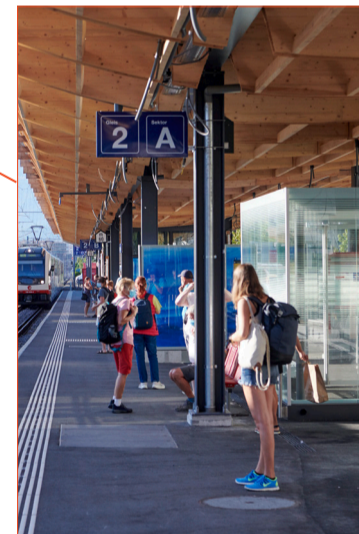
Zeitgemäss erweitert: Der neue Bahnhof Mattenhof.