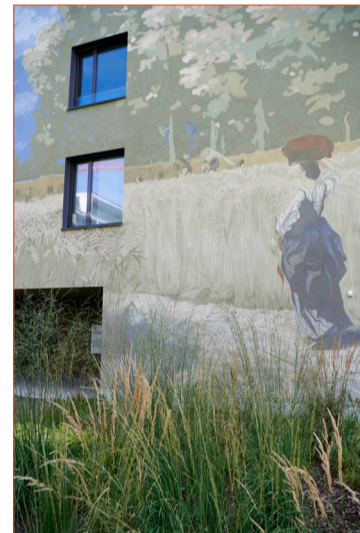
Robert Zünd gestern und heute: Kunst am Bau im Schweighof.