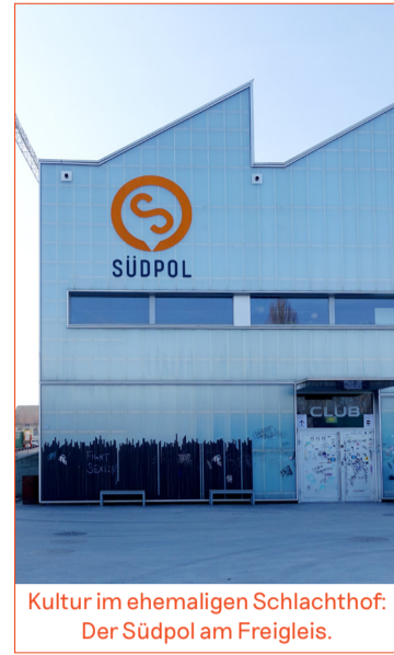
Kultur im ehemaligen Schlachthof: Der Südpol am Freigeis.